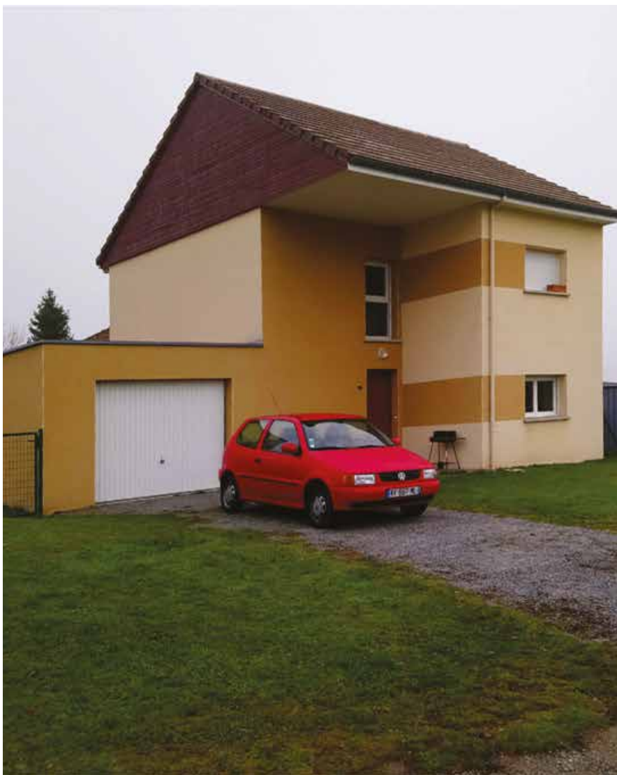
Ce pavillon fait partie des 167 logements achetés à Dom'Aulim

En rachetant des logements déjà existants, l'Office enrayer la baisse du nombre de logement qu'il gère et peut percevoir de nouveaux loyers, donc de nouvelles ressources, sans augmenter le nombre global de logements sociaux sur le département. Par ailleurs, les logements rachetés sont dans leur quasi-totalité des maisons individuelles et sont plus en adéquation avec les demandes actuelles.