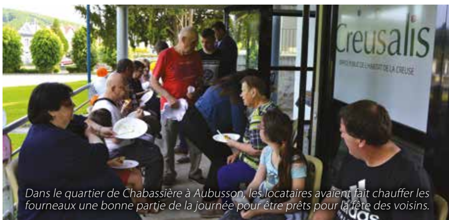
Dans le quartier de Chabassière à Aubusson, les locataires avaient fait chauffer les fourneaux une bonne partie de la journée pour être prêts pour la fête des voisins.

Le 25 mai dernier avait lieu la fête des voisins, un moment festif devenu incontournable. Chacun apporte son repas qu'il partage ensuite avec ses voisins permettant ainsi d'aller au-delà du simple « bonjour » dans le couloir ou devant l'ascenseur. Les équipes de Creusalis se sont